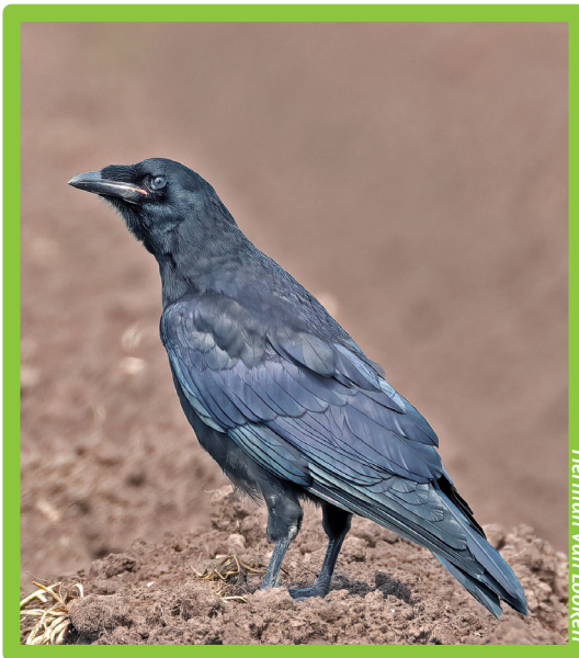
Herman Van Looken

Roeken komen in de maand februari naar de nestlocaties en beginnen met het slijpen van takken naar de oude nesten of bouwen er nieuwe bij. De aanwezigheid van deze lawaaierige burens wordt nogal eens als overlast ervaren. In Brecht begonnen in 2003 met het vernietigen van nesten op drie locaties. De brandweer spoot de nesten uit de bomen, zelfs tot ver in april, de tijd dat er reeds jonge roeken in de nesten liggen. In 2006 kwam er een einde aan deze vervolgingen. Dit verdelen had weinig zin, want roeken zijn in staat om binnen enkele dagen een nest te bouwen, wat de vogels in Brecht dan ook deden. Bovendien zocht een aantal roeken van het gemeentepark een nieuwe locatie op, een 400-tal meter verderop -waar de